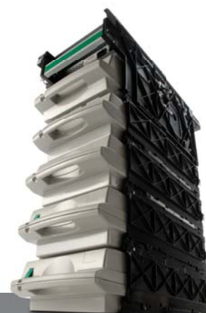
NMD 100, dispensador de billetes de Talaris

“El Grupo sigue consolidando sus cuatro competencias esenciales – autenticación, distribución, servicio y relaciones.”