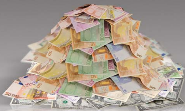
Problema con el efectivo