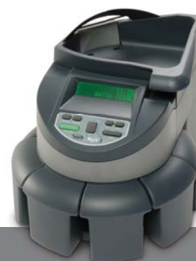
Mach 3, clasificadora/contadora de monedas de Talaris